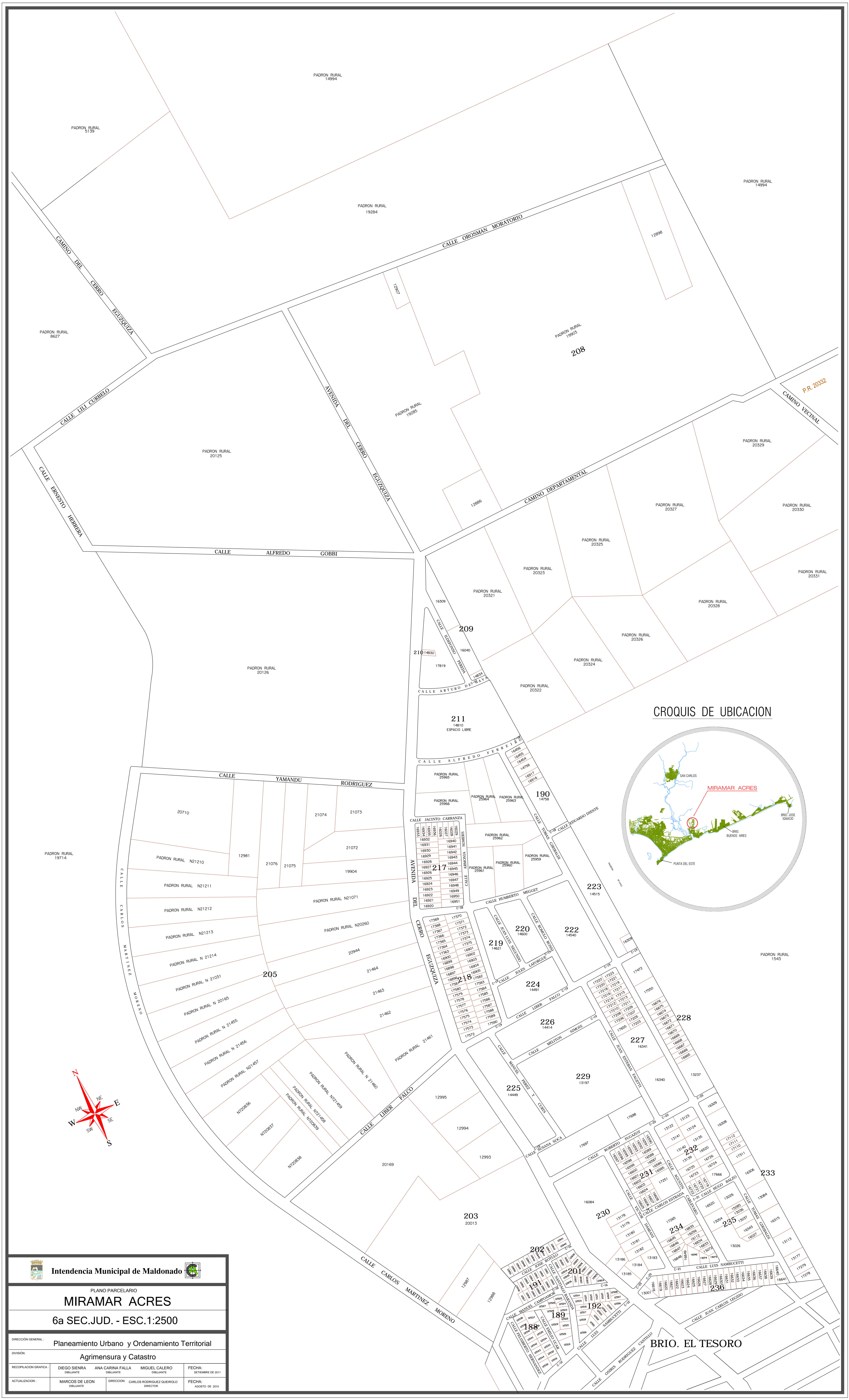
CROQUIS DE UBICACION